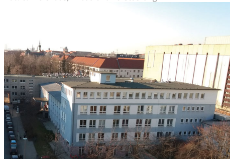
Abb. 6: Ärztehaus, Anbau und Aufstockung