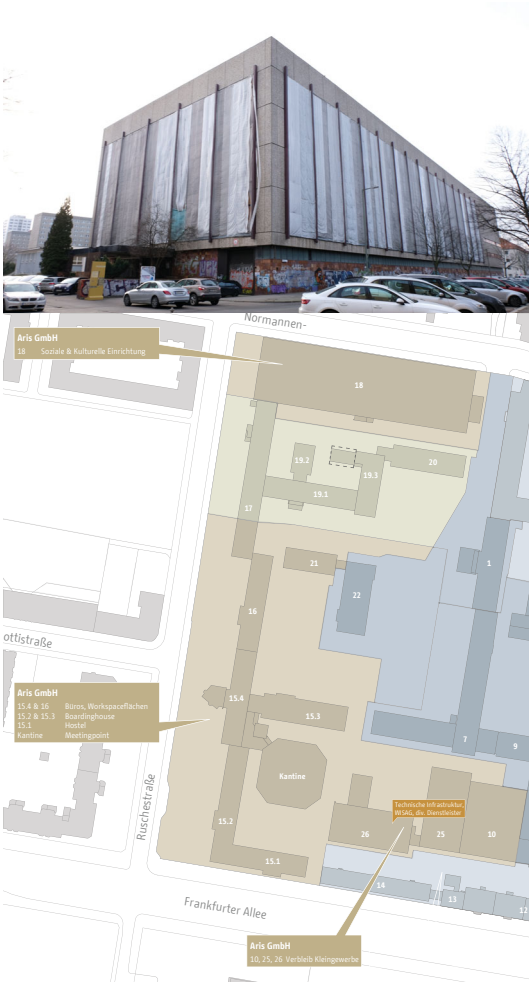
Abb. 1: Haus 18, Aris Immobiliengesellschaft mbH