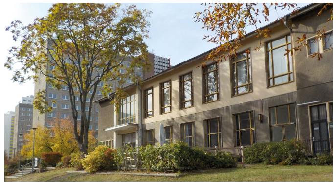
Anmerkung zu Haus 7 und 22 aus dem Bundeshaushaltsplan 2019:

... wird zugelassen, dass Räumlichkeiten auf dem Areal der ehemaligen Stasi-Zentrale in Berlin-Lichtenberg (Gebäudekomplex Normannenstraße) ... durch BStU an Aufarbeitungsorganisationen und zivilgesellschaftliche Initiativen, ... , unentgeltlich überlassen werden können. Für Veranstaltungen können Räumlichkeiten im Haus 22 an Aufarbeitungsorganisationen und zivilgesellschaftliche Initiativen, die nicht ausschließlich von der öffentlichen Hand finanziert werden, ebenfalls zunächst bis zum Abschluss der Sanierung unentgeltlich überlassen werden.