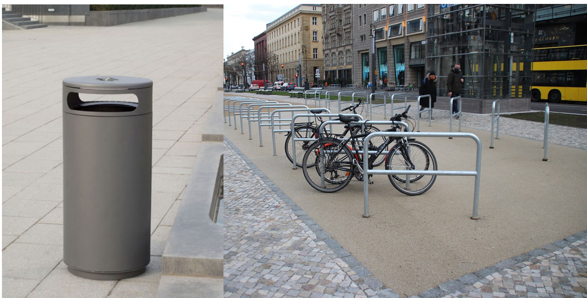
Fahrradanlehnbügel mit Mittelholm Edelstahl bzw. verzinkt (diverse Hersteller)