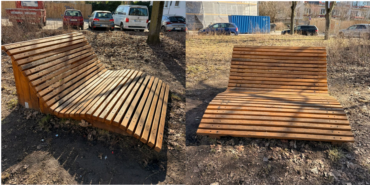
Lehnen Bank ohne und mit Armlehne (Hersteller Nordbahn gGmbH)