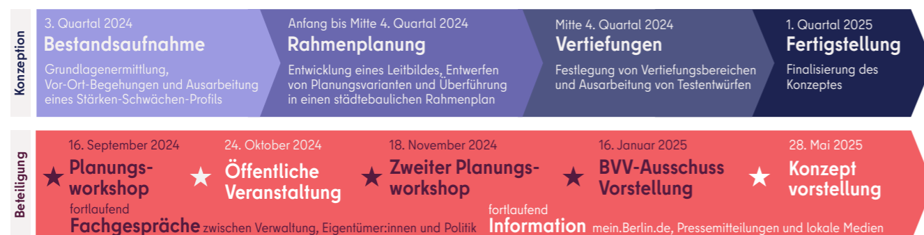
Zeitplan über den Gesamtprozess

Das IEK wurde in einem transparenten, dialogorientierten Prozess unter Einbindung von Verwaltung, Wohnungsunternehmen, Eigentümerinnen und Eigentümern sowie der Öffentlichkeit entwickelt. Das Ergebnis ist ein städtebaulicher Rahmenplan mit Musterlösungen für die Bebauung. Er dient als Leitfaden für eine sozial- und klimagerechte Entwicklung sowie der Verwaltung als fachliche Grundlage für weitere Planungen z. B. Standortplanungen für kleinere Bereiche oder Einzelflächen.