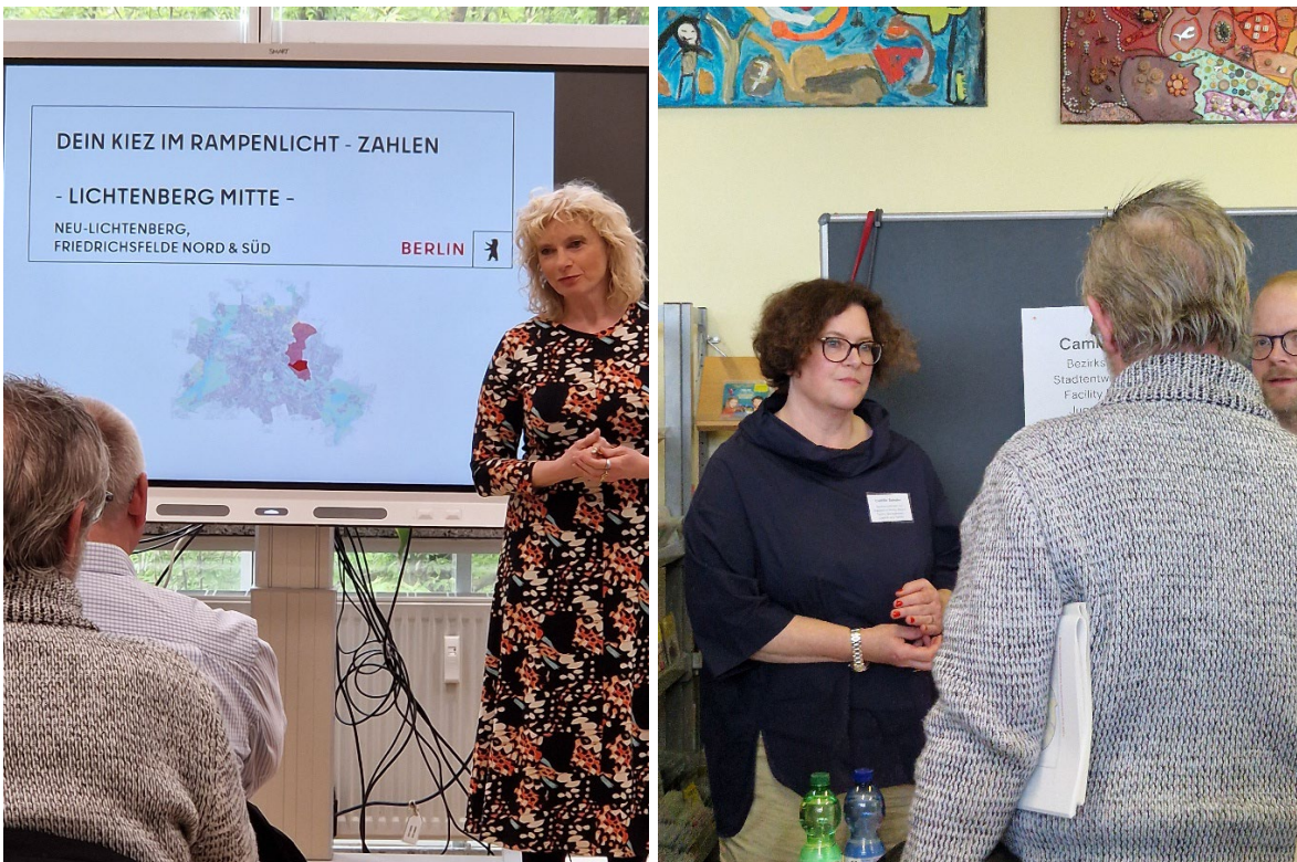
Abbildung 4 und 5: Redebeitrag der Bezirksstadträtin Dr. Catrin Gocksch (links) sowie Bezirksstadträtin Camilla Schuler im Dialog mit Teilnehmenden (rechts)